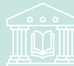
Kunst & Cultuur