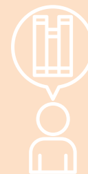
Ontwikkeling & Educatie