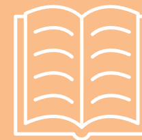
Leesbevordering & Literatuur