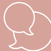
Ontmoeting & Debat